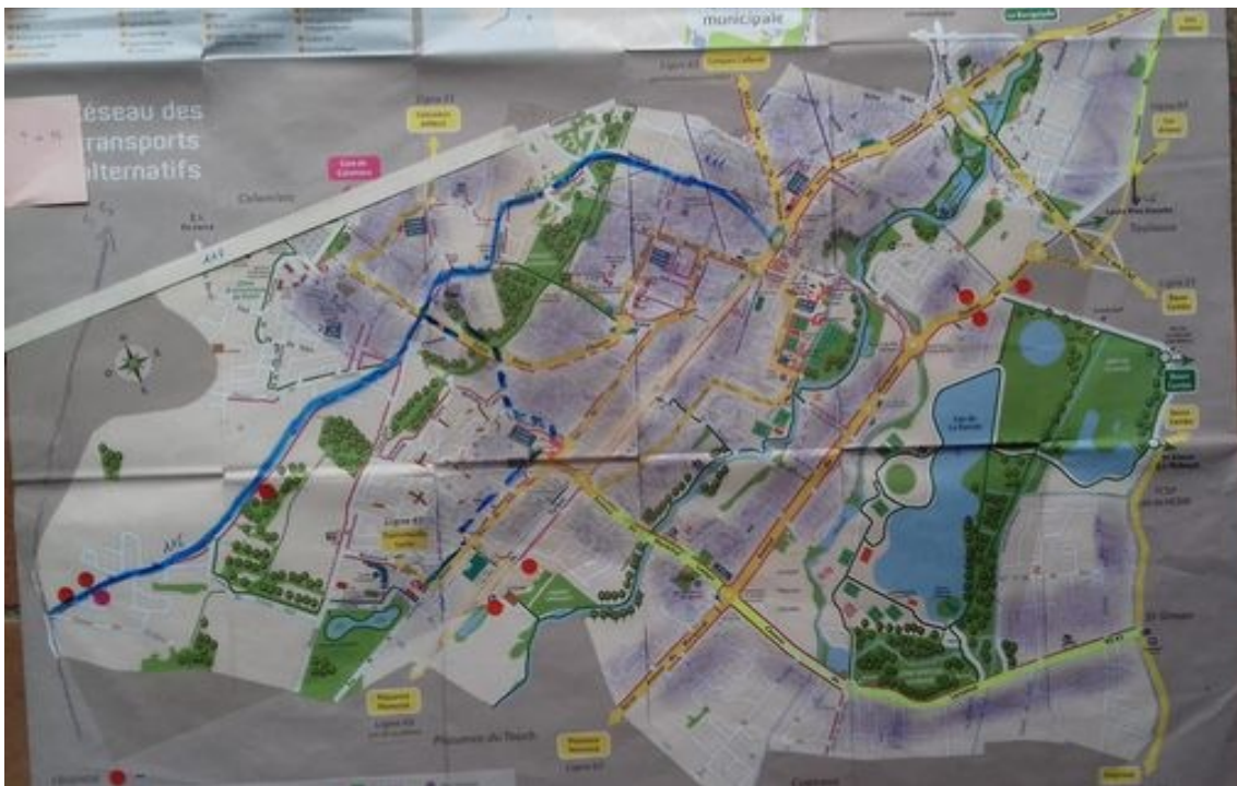
Le 116 modifié ou autre bus : zoom sur Tournefeuille.